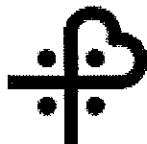
ATS SARDEGNA AZIENDA TUTELA SALUTE ASSL NUORO