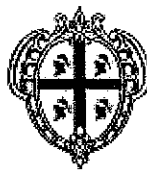
REGIONE AUTONOMA DELLA SARDEGNA